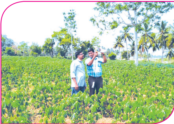
மரவள்ளியில் இலைகள் தொய்ந்து காணப்படுதல்