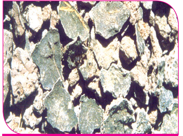
மண் படிந்த ஏடுகளாக நீலப்பச்சைப் பாசி