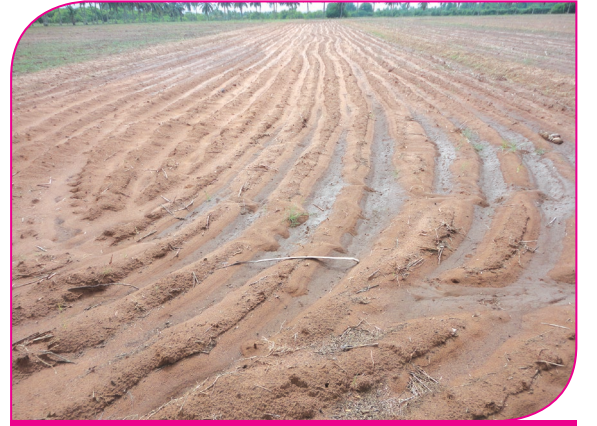
சால்களில் மழை நீர் சேகரிக்கப்படுகிறது

பெரும்பாலும் பூச்சிகள் மண்ணில் முட்டையிட்டு வளர்கின்றது. கோடை உழவினால் மண்ணில் இடப்பட்ட பூச்சி முட்டைகள் மற்றும் பட்டுப்புழுவினை வெளிக்கொணர்ந்து சூரிய ஒளியினாலும், பறவைகளினாலும் அழிக்கப்படுகின்றது. மேலும், பயிர்களுக்கு நோய் ஏற்படுத்தும் மண்ணில் வாழும் பூஞ்சாண்களும் கோடை உழவின் மூலம் அதிக சூரிய வெப்பத்திற்கு உட்படுத்துவதால் அழிக்கப்படுகின்றது.