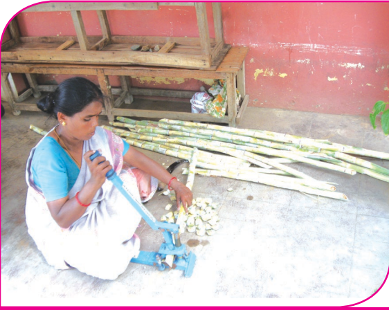
ஒரு பரு கரணை வெட்டுதல்

இருக்கின்றது. நீடித்த நவீன கரும்பு சாகுபடி முறையில் ஒரு விதைப்பரு சீவல்களிலிருந்து நாற்றங்கால் அமைத்தல் முறை முக்கிய அம்சமாக உள்ளது. அதன் மூலம் குறைந்தது 95 சதவிகித கரும்பு பயிர்களை ஆரோக்கியமாக வளர்க்க முடிகின்றது.