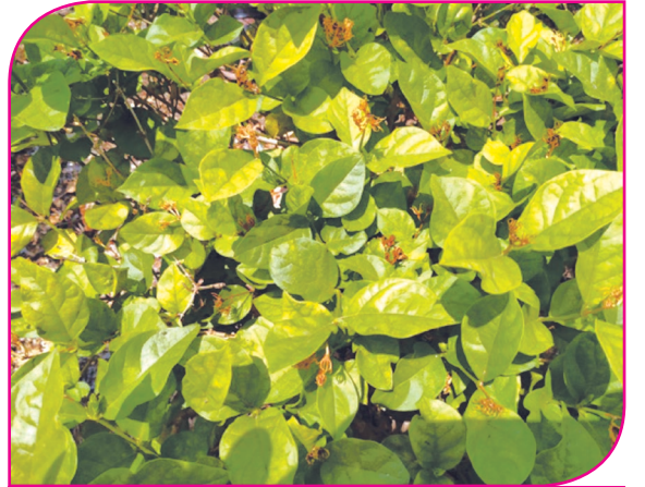
மல்லிகையில் பூக்கள் காய்ந்து காணப்படுதல்

விளைச்சல் இழப்பிலிருந்து பாதுகாக்குமாறு கேட்டுக்கொள்கின்றோம்.