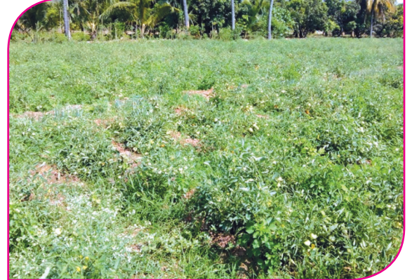
தக்காளியில் இலை சுருண்டு காணப்படுதல்