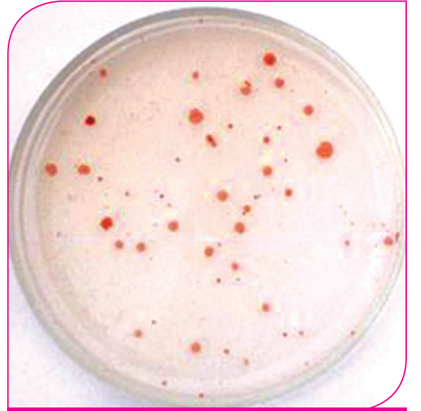
இளஞ்சிவப்பு நிறமுடைய மெத்தைலோ பாக்டீரியம்

பத்து கிலோ அளவு மைக்கோரைசாவை 100 கிலோ மண்ணுடன் கலந்து பாலித்தீன் பைகளில் நிரப்பி விதைப்பதற்கு பயன்படுத்தலாம். பாலித்தீன் பையில் வளர்க்கப்படும்