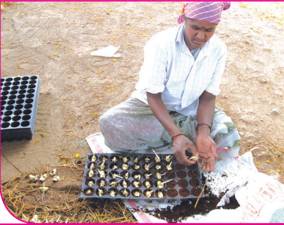
குழித் தட்டில் பருசீவலை வைத்தல்

அழுத்த வேண்டியதில்லை. விதைப்பரு மேல் நோக்கி இருக்கும் வண்ணம் வைக்க வேண்டும். பிறகு மண் உரக் கலவையினால் நிரப்பி விடவும். பாலித்தீன் விரிப்பின் மீது குழித்தட்டுகளை ஒன்றின் மீது ஒன்றாக அடுக்கி, அடுக்கு ஒன்றுக்கு 25 குழித்தட்டுகள் வீதம் நான்கு அடுக்குகளாக அருகருகே வைத்து 5 முதல் 8 நாட்கள் வரை மூடி வைத்திருக்க வேண்டும். இதனால் பாலித்தீன் விரிப்புக்குள் வெப்பநிலை உயர்ந்து எல்லா விதைப் பருக்களும் ஒரே நேரத்தில் முளைக்கும். இரண்டு அல்லது மூன்று நாட்களில் விதைப்பரு முளை விட ஆரம்பிக்கும்.