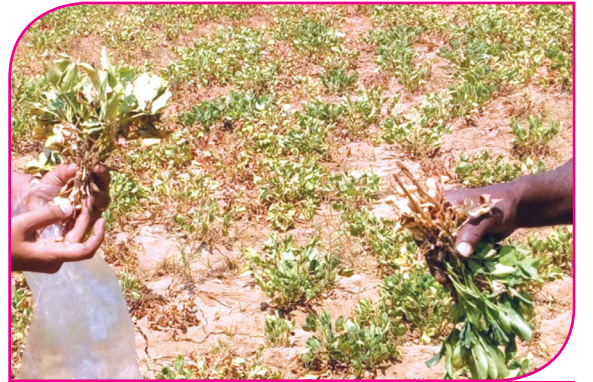
நிலக்கடலையில் காய்களின் எண்ணிக்கை குறைதல்