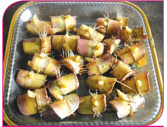
ஐந்து நாள் மூட்டம் போட்ட பரு

வெட்டப்பட்ட கரும்பிலிருந்து ஒரு விதைப் பரு சீவல்களை வெட்டுக் கருவி கொண்டு வெட்டி எடுக்கலாம். உடனடியாக சீவல்களை வெட்ட முடியாத நிலையில், வெட்டப்பட்ட கரும்புகளை ஒரு வாரம் வரை நிழலில் வைத்துப் பாதுகாக்கலாம். விதைப்