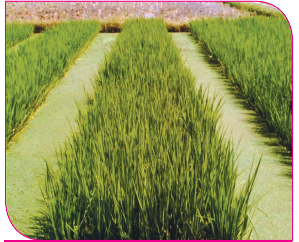
ஒரு பயிர் முறையில் வயலில் இடுதல்

நாற்று நேர்த்தி முறை நெல், புகையிலை, தக்காளி, மிளகாய், வெங்காயம், முட்டைக் கோஸ், காலிபிளவர் போன்ற பயிர்களுக்கு பரிந்துரைக்கப்படுகின்றது. தண்ணீர் 10 - 15 லிட்டரை, 1 கிலோ உயிர் உரக்கலவையுடன் சேர்த்து, ஒரு எக்டருக்குத் தேவையான நாற்றுகளின் வேர்களை, 30 நிமிடங்கள் இக்கலவையில் ஊற வைக்க வேண்டும். அதன் பிறகு நாற்றுக்களை எடுத்து நடுதல் வேண்டும்.