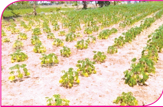
மரவள்ளியில் அடி இலை மஞ்சளாகுதல்