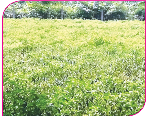
மிளகாய் செடி வாடி தொய்ந்து காணப்படுதல்