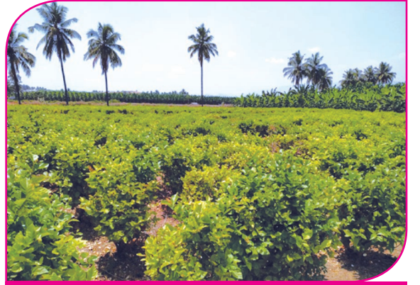
மல்லிகை செடி மஞ்சளாக காணப்படுதல்