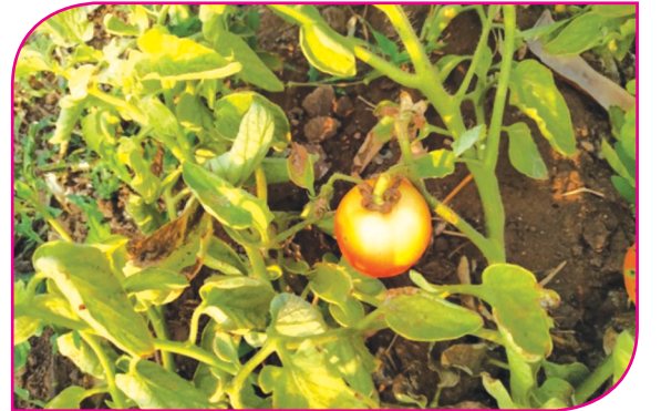
செடி மஞ்சளாகுதல், பழம் வெளிர்ந்து காணப்படுதல்