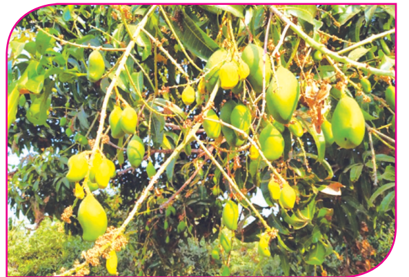
மாவில் பிஞ்சுகள் வெளிர்ந்து காணப்படுதல்